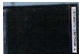
メークリンゲルあり (With May clean gel)