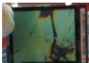
メークリンゲルなし (Without May clean gel)